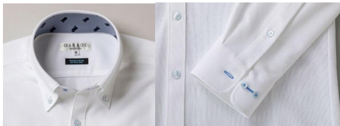
川崎フロンターレ仕様の衿裏の別生地と袖口の色系