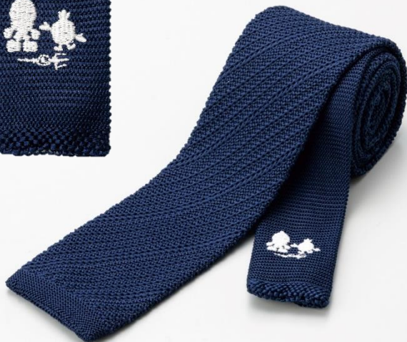
小剣には「ふろん太」「カブレラ」「ORIHICAの鍵マーク」の刺繍