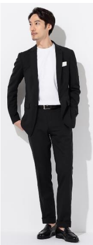
ウォッシュブル リネン混スーツ

これからもORIHICAは、お客さまのニーズにお応えし、商品を開発・販売してまいります。