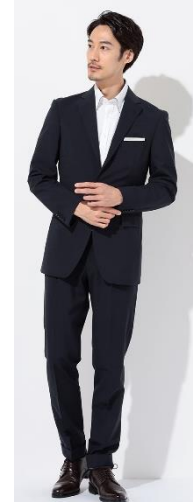
ウォッシュブル サッカースーツ