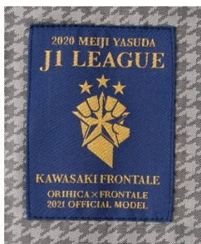
④内側のチャンピオンロゴ