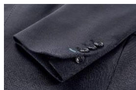
②袖のボタンホールはブルー