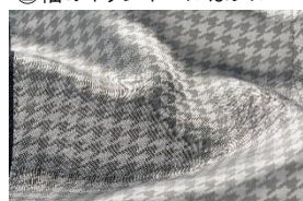
③裏地はシルバーの千鳥柄