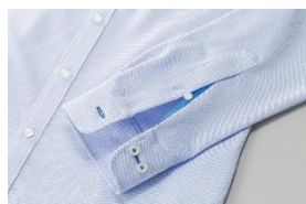
③細部までフロンターレ仕様