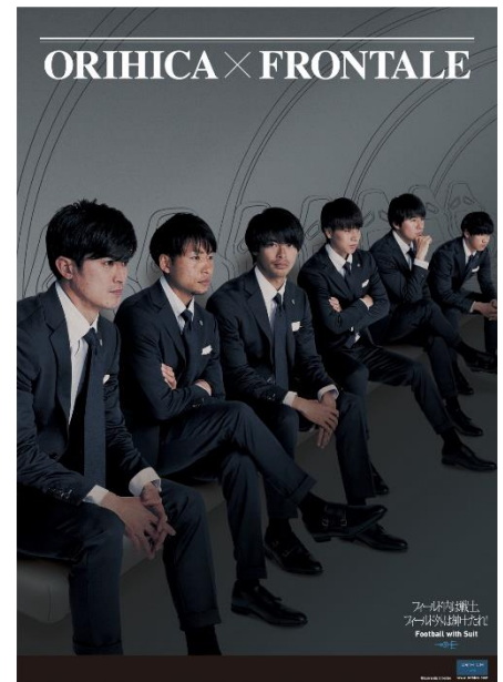
スーツ購入特典プレゼント ポスターイメージ