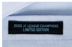
④2020年リーグチャンピオンネーム

※2021オフィシャルピズポロシャツ・2021オフィシャルネクタイは下記の店舗のみで取り扱い。