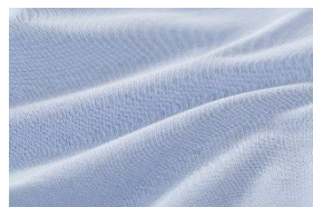
②伸縮性のある素材