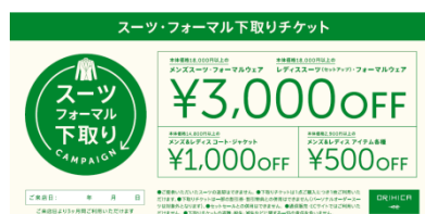
下取りキャンペーン チケット画像