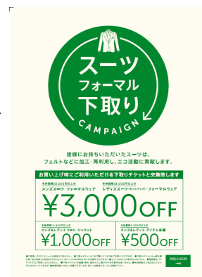
下取りキャンペーン ポスター画像

下取りキャンペーンページURL ( https://www.orihica.com/special/tradein.php )