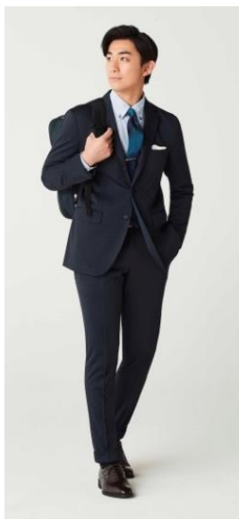
THE THIRD SUITS® サイズ：SS～3L 素材：ポリエステル100% 色：紺・グレー ジャケット16,800円(税別) パンツ7,900円(税別)

株式会社AOKI(代表取締役社長：中村宏明)が展開する『ORIHICA』が、2015年5月に「ゆるすぎず、堅すぎない次世代スーツ」をコンセプトに発売を開始した「THE THIRD SUITS®」は登場から今年で4年目を迎えました。今秋冬シーズンでは新たに伸縮性のあるニット素材のセットアップなど全6種類にラインナップを増やし、ORIHICA全店、およびオンラインショップ( https://onlineshop.orihica.com )にて発売いたします。