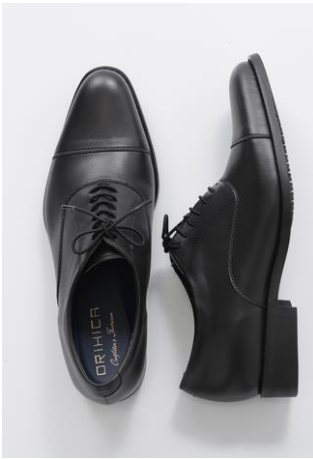
商品名:スポットフィット®レイン アッパー:人工皮革 ソール:合成底 カラー:黒 サイズ:24.5~27.5cm 本体価格:12,800円

株式会社AOKI(代表取締役社長：中村宏明)が展開する『ORIHICA』は2013年から展開するビジネスシューズ「スポットフィット®」の販売強化を行うため、新しく雨天での着用を考慮した「スポットフィット®レイン」を企画。ORIHICA全店ならびにオンラインショップにて販売を強化します。(オンラインショップURL: https://onlineshop.orihica.com/ )