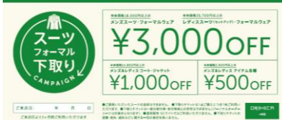
下取りキャンペーン チケット画像