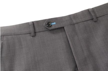
サックスブルーのボタンホール糸