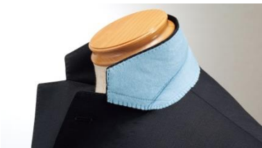
②サックスブルーの襟裏クロス