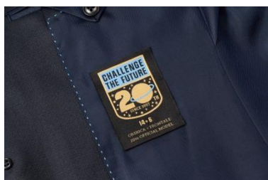
③ジャケット内側に施したオリジナルネーム