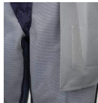
ひざ部分のメッシュ裏地