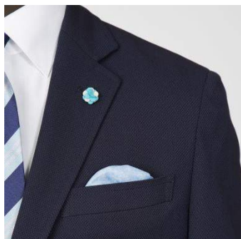
ブートニエールと フェイクチーフ仕様